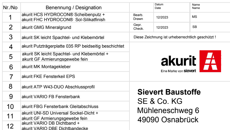
Vertikalschnitt unterer Fensteranschluss WDVS M. ca 1:2,5